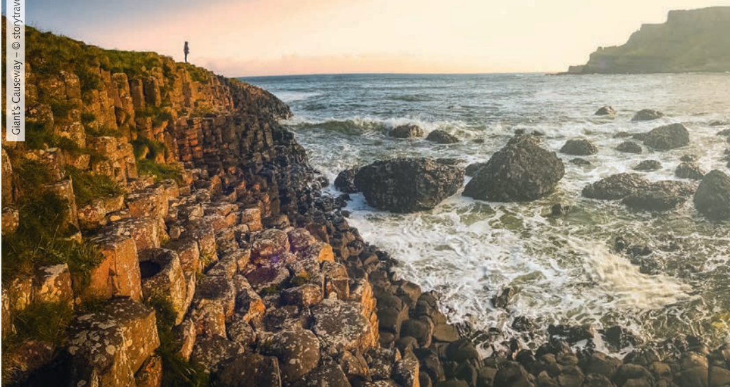
Giant's Causeway