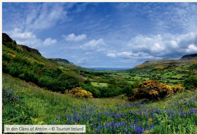
In den Glens of Antrim