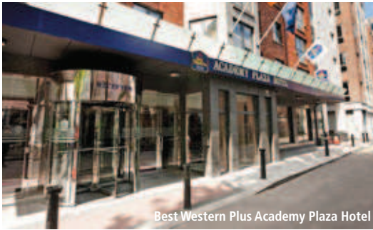
Best Western Plus Academy Plaza Hotel