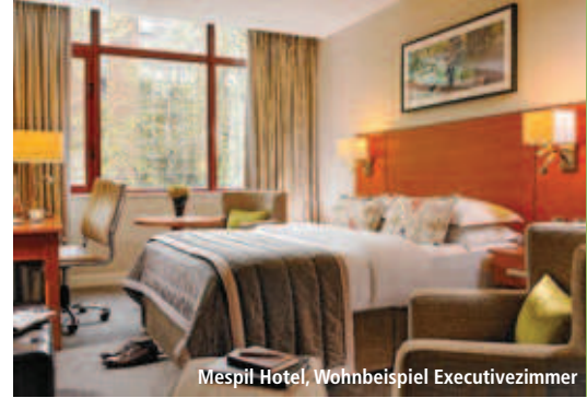
Mespil Hotel, Wohnbeispiel Executivezimmer