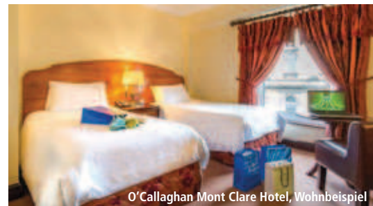
O'Callaghan Mont Clare Hotel, Wohnbeispiel