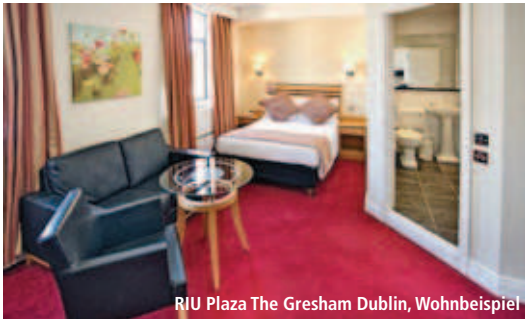
RIU Plaza The Gresham Dublin, Wohnbeispiel