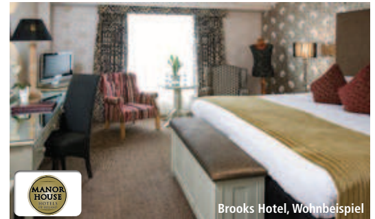
Brooks Hotel, Wohnbeispiel