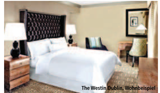
The Westin Dublin, Wohnbeispiel

Preisvorteil: für Freitagnacht vom 1.1.-28.2. und 1.11.-31.12. sowie für Sonntagnacht gelten günstigere Preise gemäß Buchungssystem.