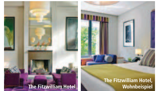
The Fitzwilliam Hotel, Wohnbeispiel