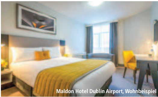
Maldon Hotel Dublin Airport, Wohnbeispiel