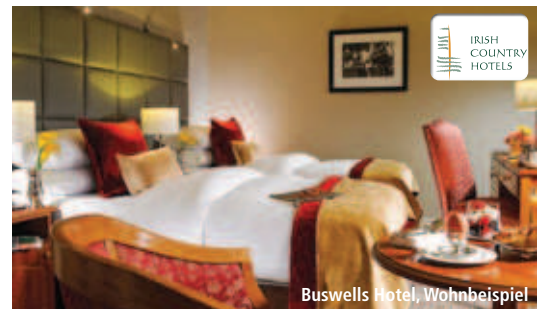
Buswells Hotel, Wohnbeispiel