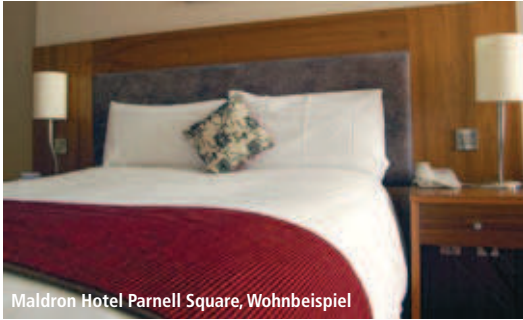
Maldron Hotel Parnell Square, Wohnbeispiel