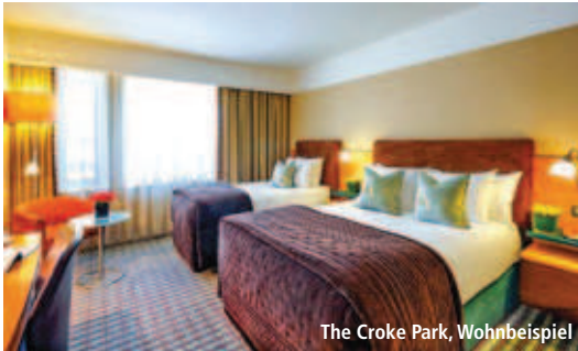
The Croke Park, Wohnbeispiel