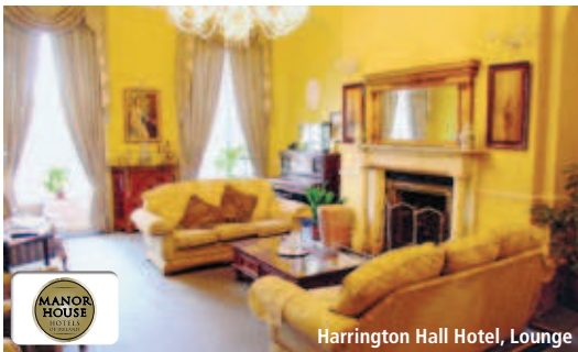
Harrington Hall Hotel, Lounge