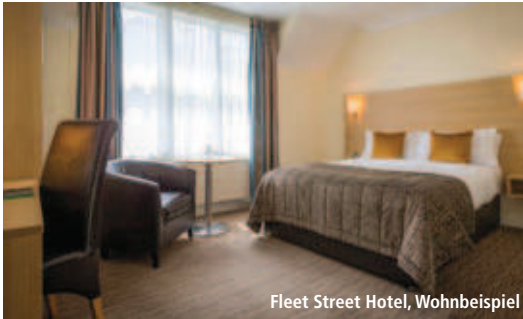
Fleet Street Hotel, Wohnbeispiel