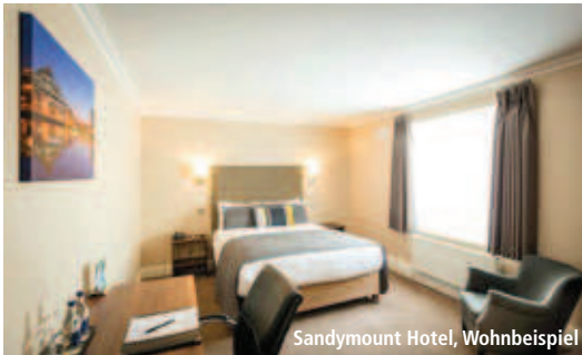
Sandymount Hotel, Wohnbeispiel

! Spartermine: 3 = 2 Anreise 1.1.-29.1. und 1.11.-31.12., bei Anreise sonntags bis dienstags, einmalig.