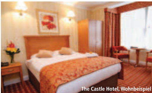
The Castle Hotel, Wohnbeispiel