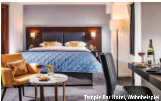
Temple Bar Hotel, Wohnbeispiel