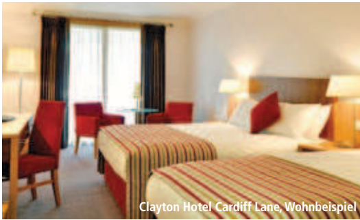
Clayton Hotel Cardiff Lane, Wohnbeispiel