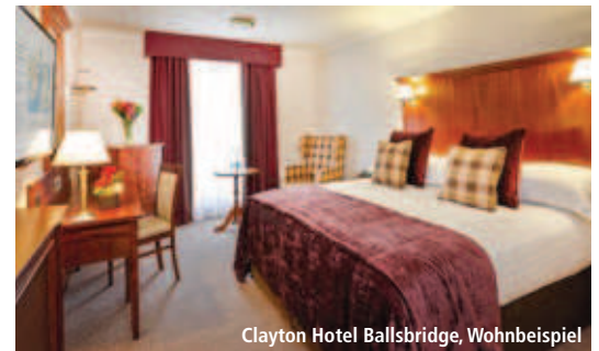
Clayton Hotel Ballsbridge, Wohnbeispiel