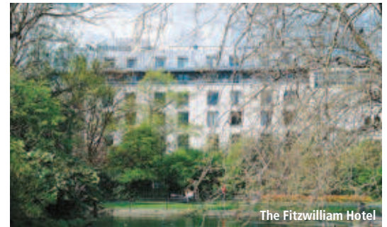
The Fitzwilliam Hotel