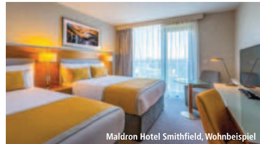
Maldron Hotel Smithfield, Wohnbeispiel