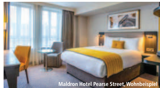
Maldron Hotel Pearse Street, Wohnbeispiel

Flug: Seiten 16-18 | Mietwagen: Seiten 19-23 | Wissenswertes: Seiten 240/241