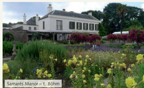
Samarès Manor