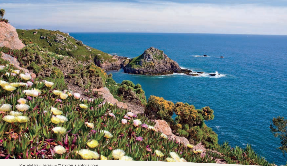
Portelet Bay, Jersey