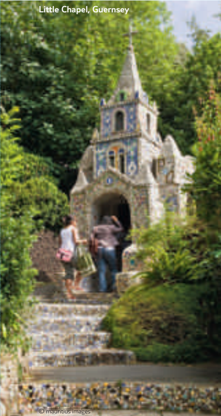
Little Chapel, Guernsey