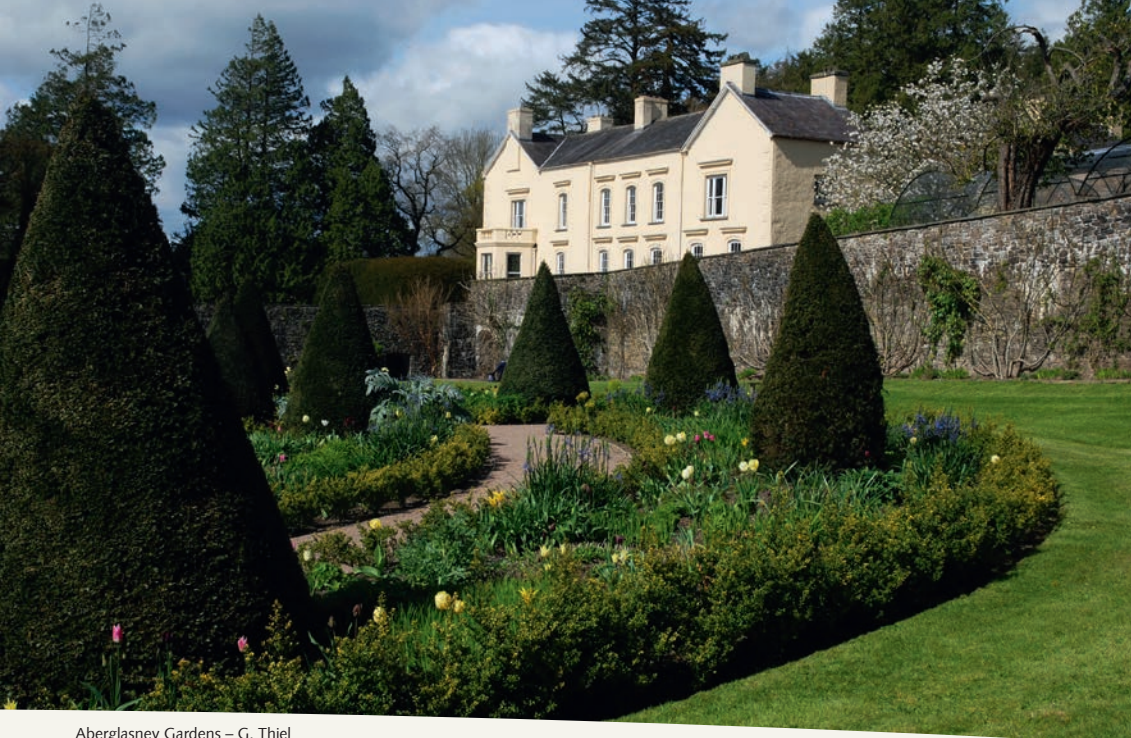
Aberglasney Gardens – G. Thiel