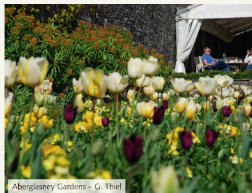
Aberglasney Gardens – G. Thiel