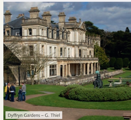
Dyffryn Gardens – G. Thiel